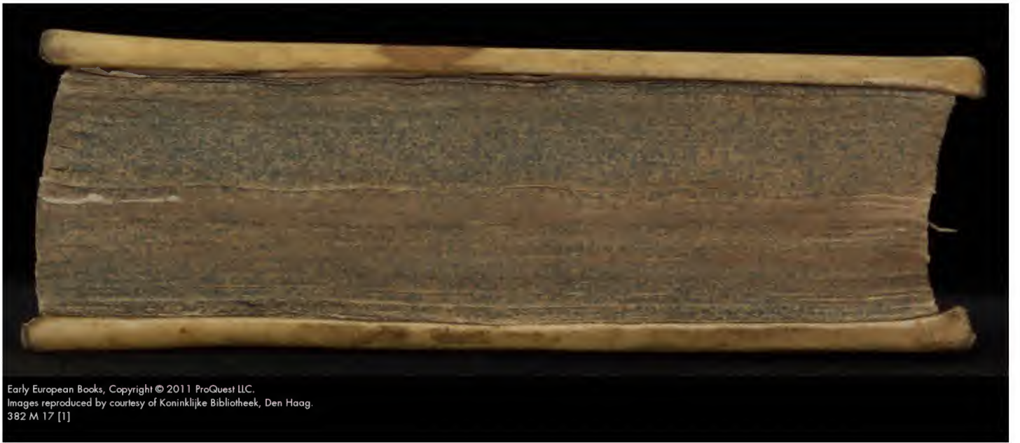
382 M 17 [1]